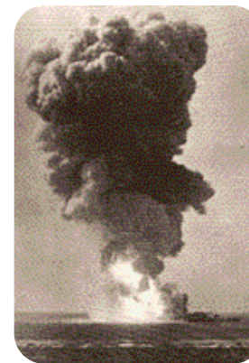
... e l'esplosione finale