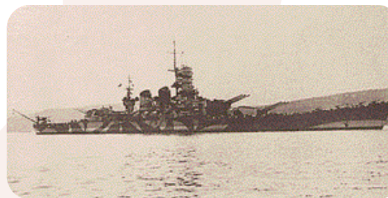
La "Roma" nel bacino di La Spezia

La "Roma" lasciò il porto seguita da altre due corazzate, tre incrociatori e otto cacciatorpediniere dirigendo verso La Maddalena. Ma intanto a Berlino era giunto l'allame: «La flotta italiana è partita nella notte per consegnarsi al nemico». Poche ore dopo La Maddalena